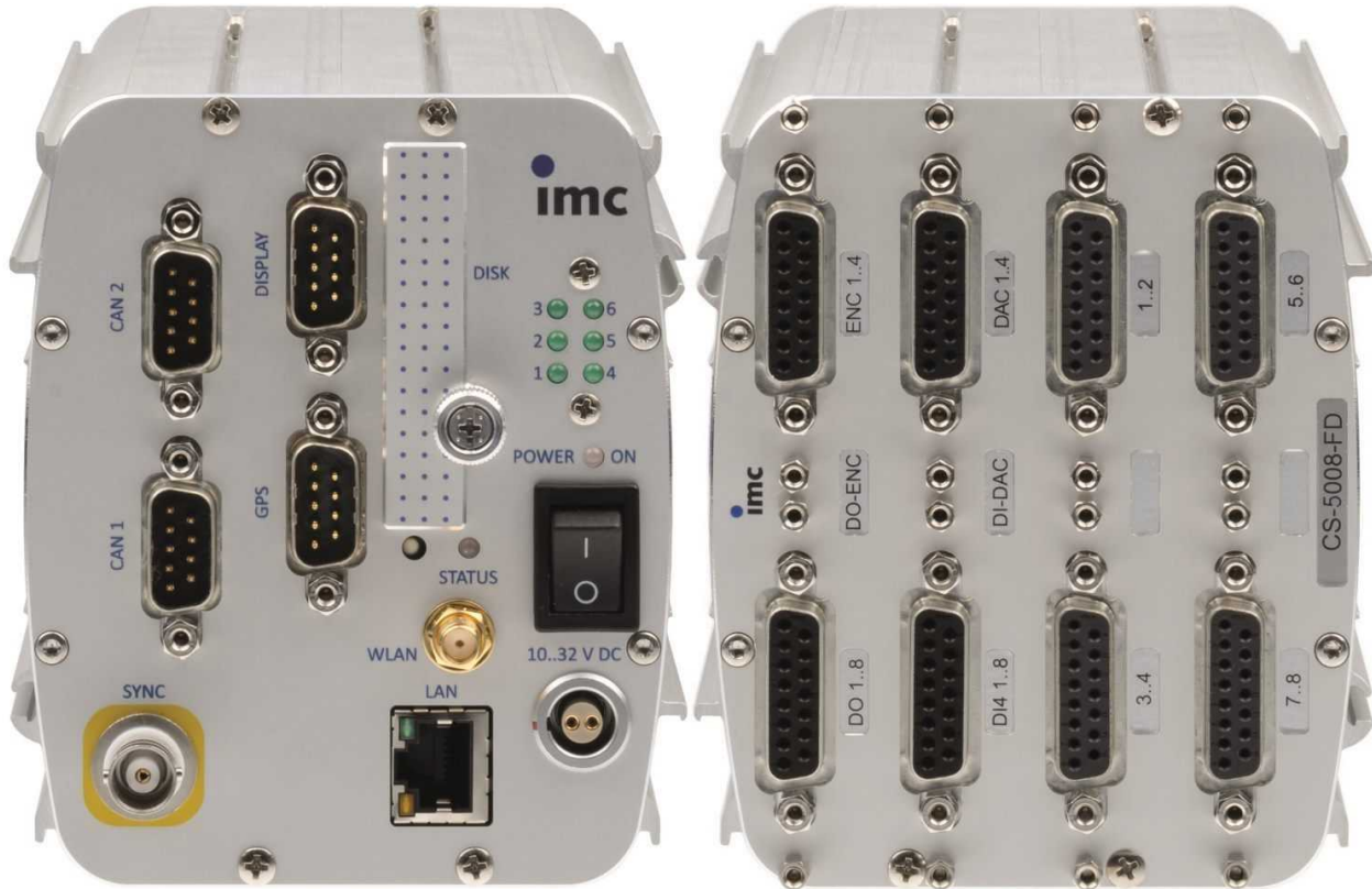
Gerätetyp: CS-5008-FD, 8 analoge Messeingänge

Intelligentes Kompaktmessgerät für DMS- und Brückenmessungen