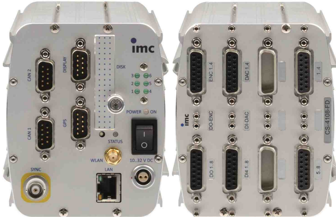
Gerätetyp: CS-4108-FD, 8 analoge Messeingänge

Intelligentes Kompaktmessgerät mit isolierten Eingängen