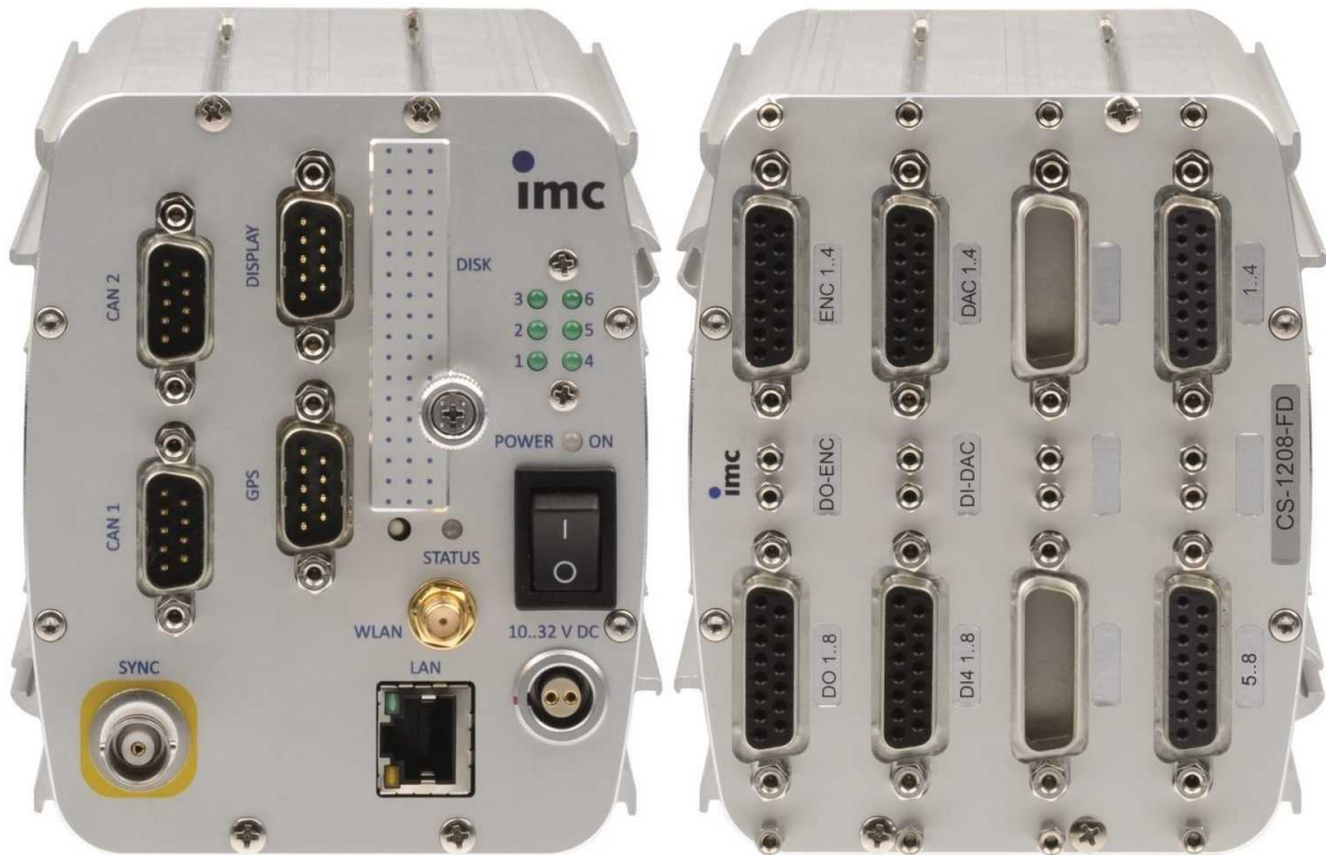
Gerätetyp: CS-1208 (Abb. ähnlich), 8 analoge Messeingänge

Intelligentes Kompaktmessgerät für Spannungsmessungen mit umfangreicher Zusatzausstattung