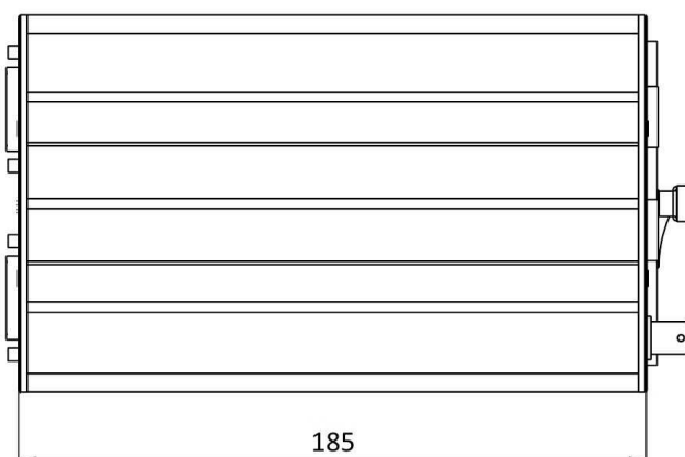
Die Abbildung zeigt ein CS Gerät in Standard-Gebrauchslage.